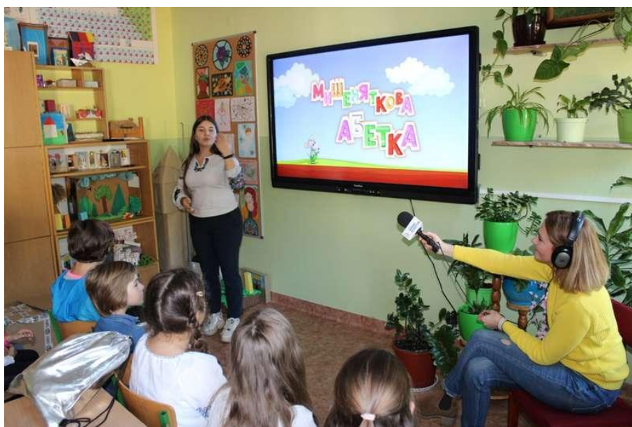
"Літературна гостина 2019" в Бартошицях.

"Літературна гостин 2019" так називався цей фестиваль відбувся у м. Бартошиці (3-4 жовтня) та м. Ельблонг (5-6 жовтня). Програма заходу була насиченою та різноманітною за змістом – лекції, віртуальні мандрівки, інтерактивні ігри, майстер-класи, голосні читання, перегляди українського кіно, творчі зустрічі з українськими письменницями.