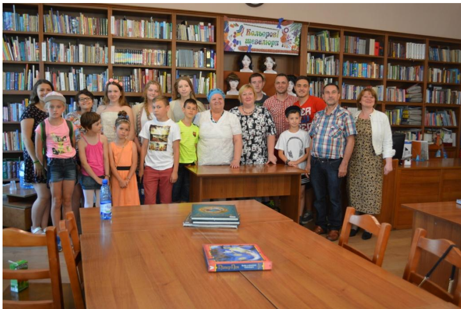
Зустріч у львівській бібліотеці 2016р.