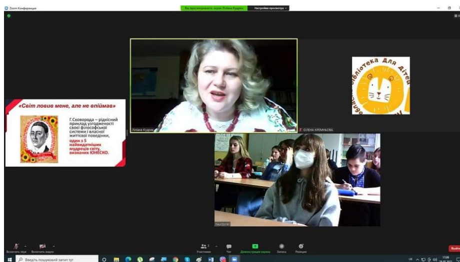
Зустріч "Наука Григорія Сковороди і сучасні дослідження" в Ольштині.