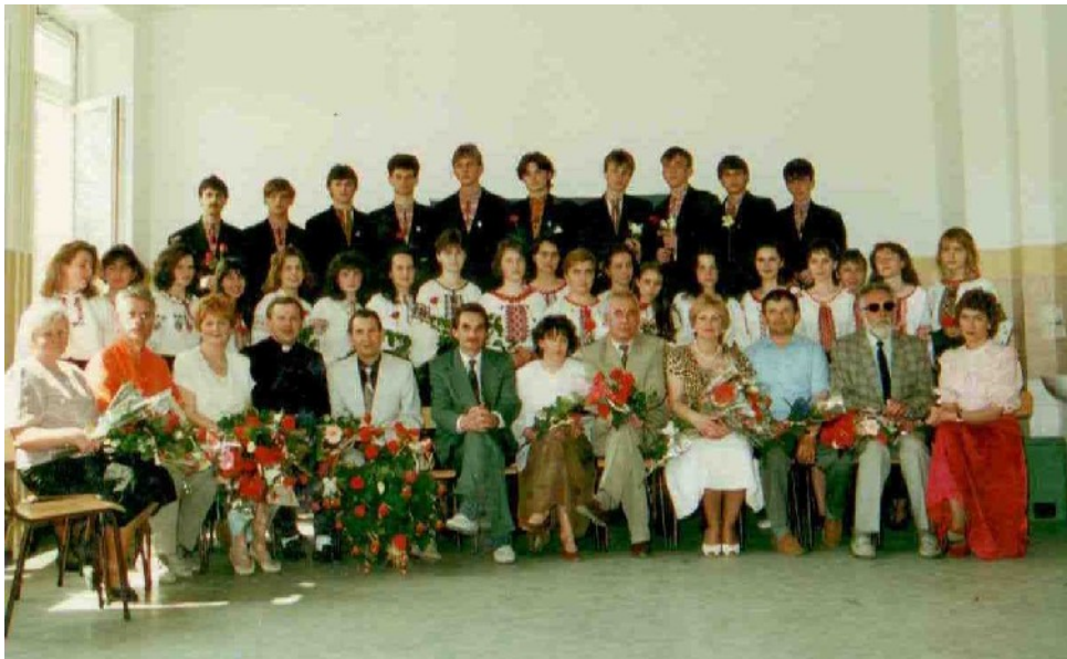
ВЧИТЕЛЬСЬКИЙ КОЛЕКТИВ З ВИПУСКНИКАМИ 1993 р.