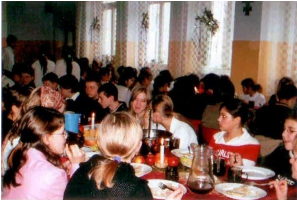
ЩЕДРИЙ ВЕЧІР В ГУРТОЖИТКУ 2006 р.