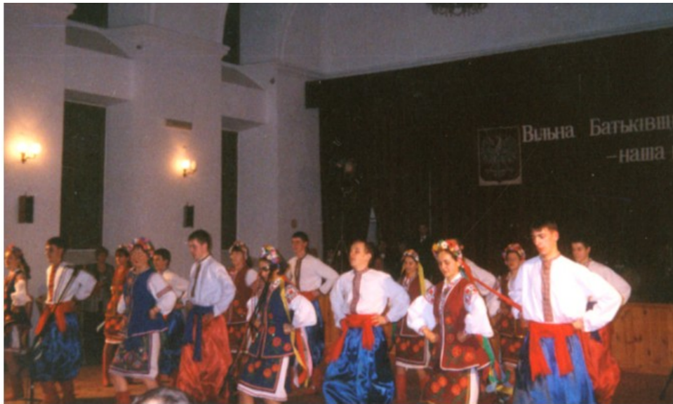
ТАНЦЮВАЛЬНИЙ АНСАМБЛЬ «ГОРИЦВІТ» НА ШЕВЧЕНКІВСЬКОМУ ВЕЧОРІ У ЛІГНИЦІ