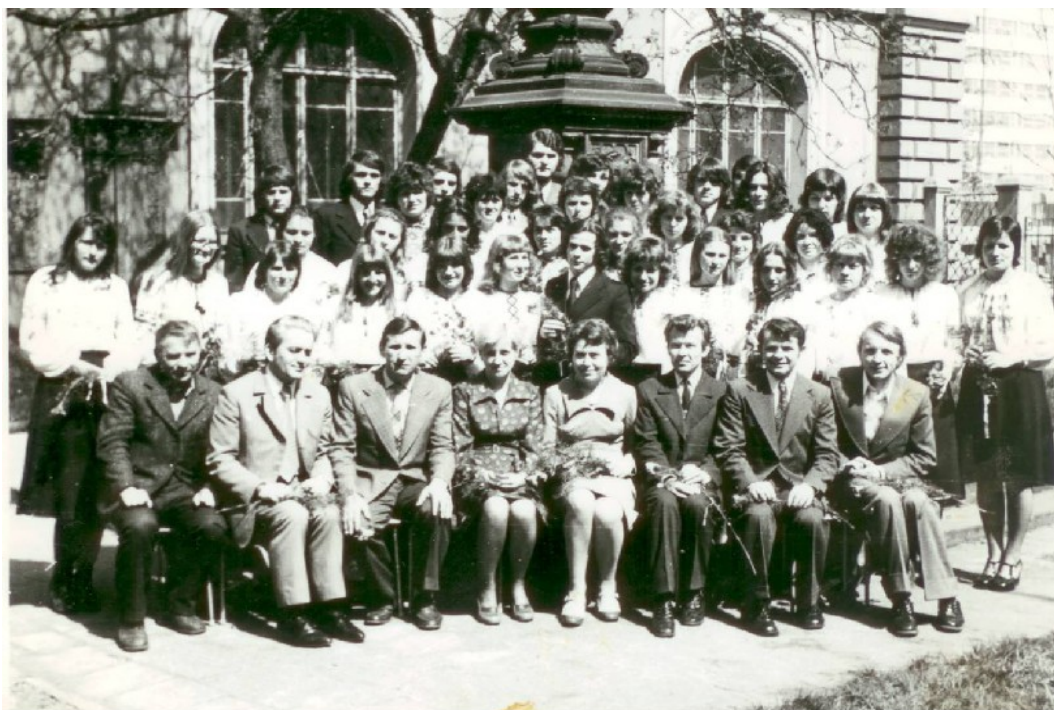
ВЧИТЕЛІ З ВИПУСКНИКАМИ 1974/1975