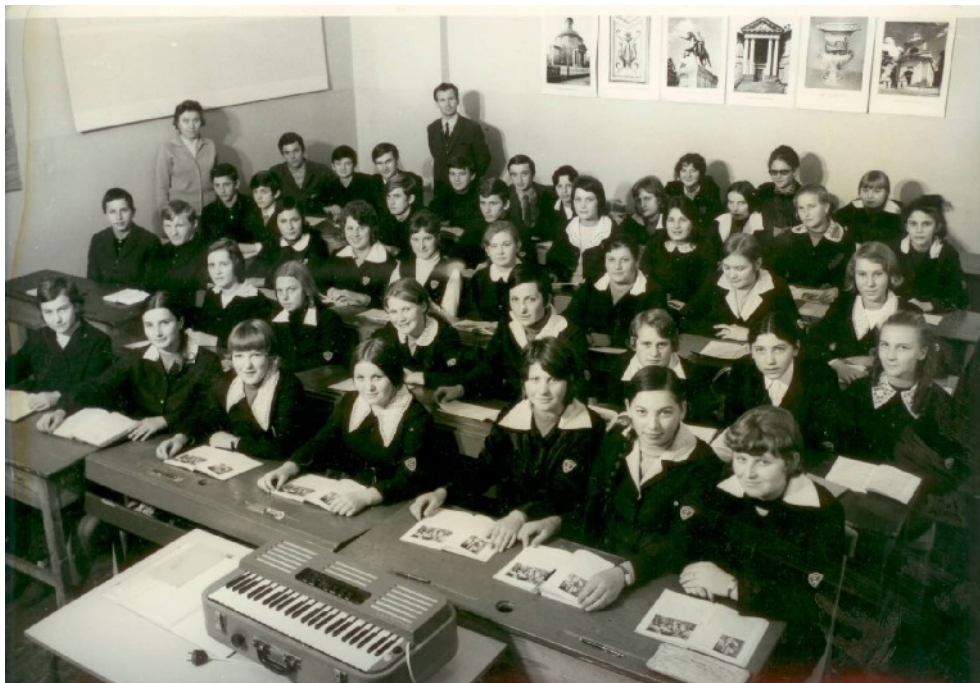
IV ЗАГАЛЬНООСВІТНІЙ ЛІЦЕЙ В ЛІГНИЦІ

Протягом тих 50-ти літ школу закінчило кількасот випускників, мінялись вчителі і директори. І щоб пам'ять про них не вгасала, і щоб спогади ожили про спільно прожиті літа даємо до рук читачів цей нарис історії нашої школи.