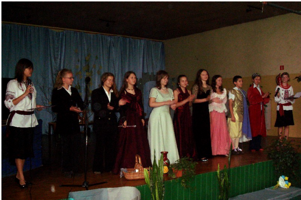
ТЕАТРАЛЬНИЙ ГУРТОК З ВИСТАВОЮ « ПОПЕЛЮШКА»