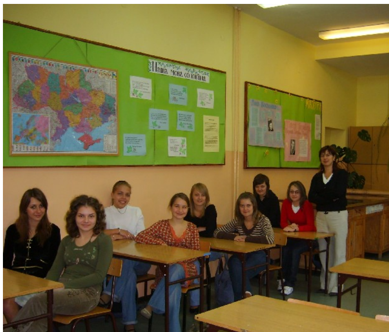
УРОК В КЛАСІ УКРАЇНСЬКОЇ МОВИ