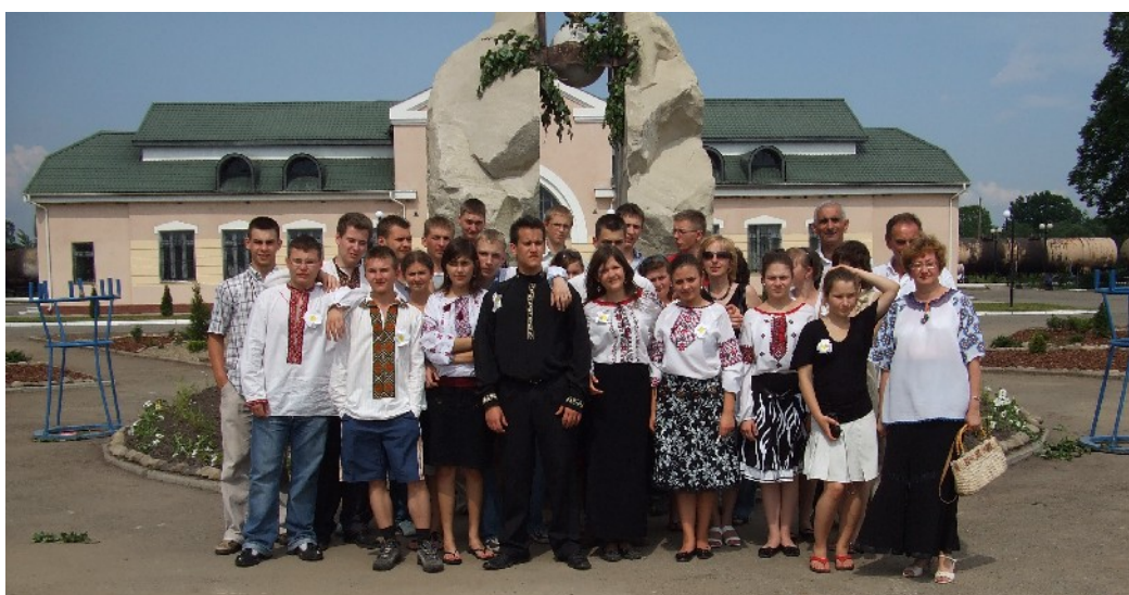
НАША МОЛОДЬ В ГАЛИЧІ 2007 р.

1999 р. – поїздка танцювального ансамблю „Горицвіт” в оздоровчо-відпочинковий табір „Скоморохи” (біля Тернополя ). Делегація була запрошена Тернопільським Управлінням Освіти і Комітетом професійно-технічної освіти Управління Освіти. Перебування делегації у Львові 1991р. – поїздка до Львова на святкування Дня міста Львова (на запрошення Управління освіти Департаменту гуманітарної та соціальної політики Львівської міської ради.