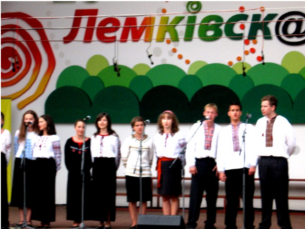
КОНЦЕРТ «ДИКИХ БДЖІЛ» НА ЛЕМКІВСЬКИЙ ВАТРИ