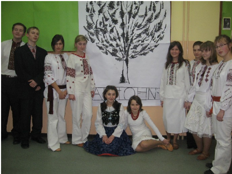
ВЕЧІР ЛІРИКИ БОГДАНА ІГОРА АНТОНІЧА