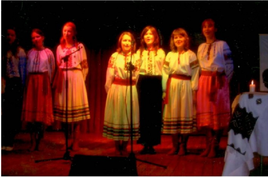
ШЕВЧЕНКІВСЬКИЙ КОНЦЕРТ У МОДЛІ 2007р.