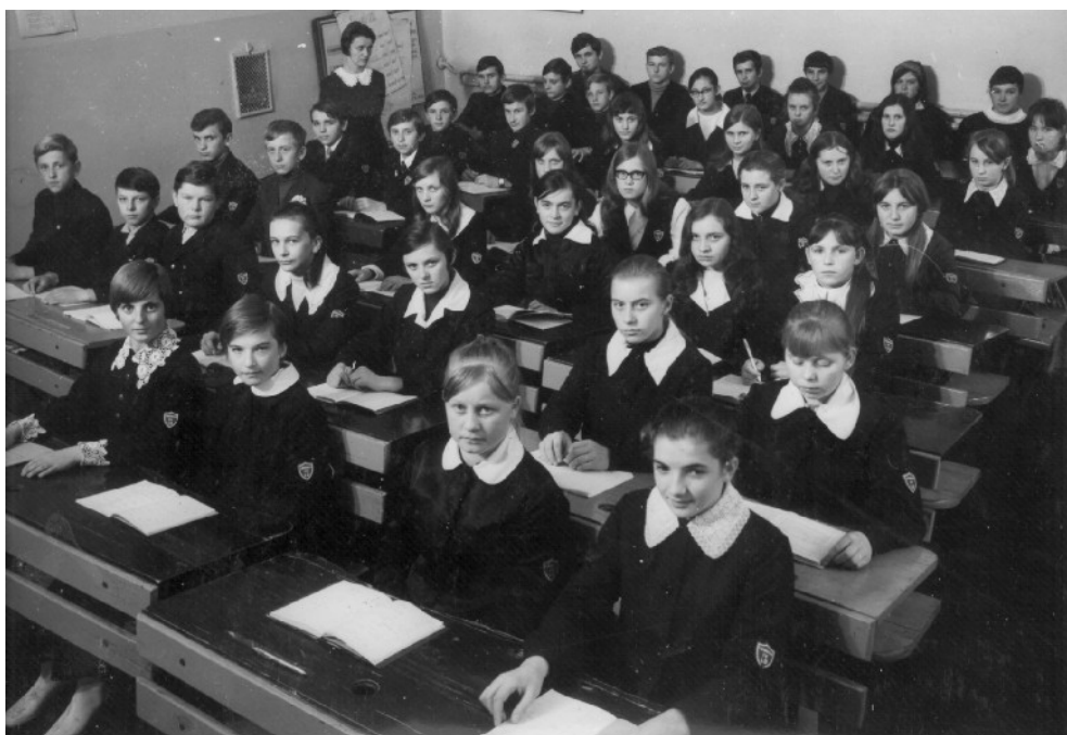
IV ЗАГАЛЬНООСВІТНІЙ ЛІЦЕЙ В ЛІГНИЦІ