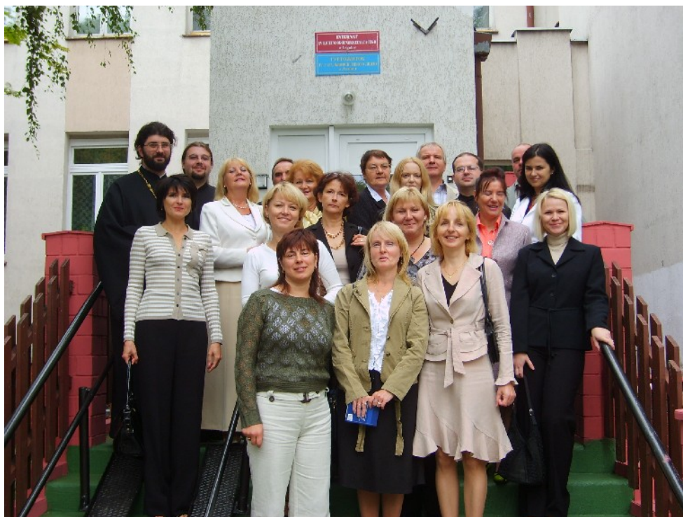
ВЧИТЕЛЬСЬКИЙ КОЛЕКТИВ У 2007 р.

На пості директора не було стільки змін, як у вчительському гроні.