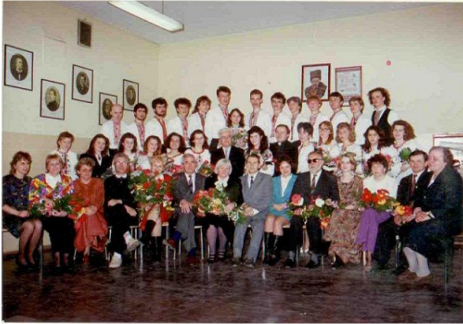
ВЧИТЕЛЬСЬКИЙ КОЛЕКТИВ З ВИПУСКНИКАМИ 1992 р.