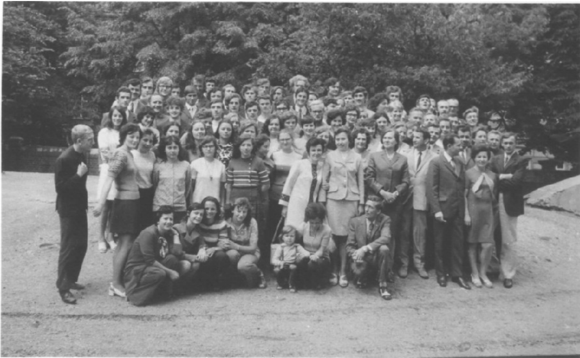
УЧАСНИКИ З'ЇЗДУ ВИПУСКНИКІВ 23 -24 ЧЕРВНЯ 1973 р.

У гуртожитку жило 58 учнів. Будинок цей не відповідав вимогам школи, мало було приміщень на кабінети. Після кількох років наполегливих домагань, у навчальному році 1967/68 школа одержала приміщення в будинку на площі А. Завадського 7а (тепер Площа Кляшторний).