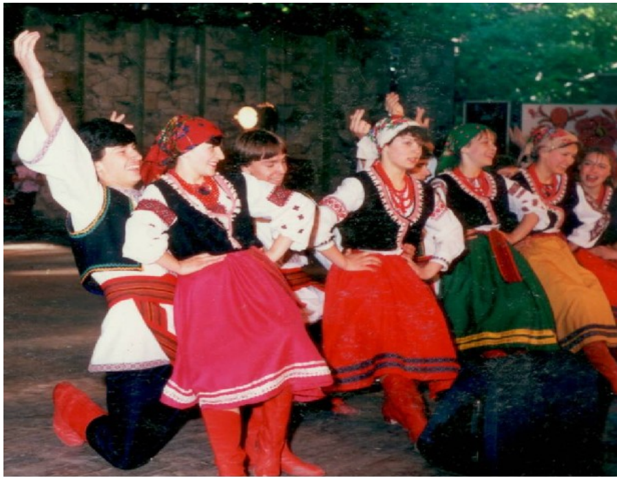
ТАНЦЮВАЛЬНИЙ АНСАМБЛЬ У СОПОТІ

Слід згадати учасників-учнів, які розвинули свої здібності, стали зірками не лише у нашій школі.