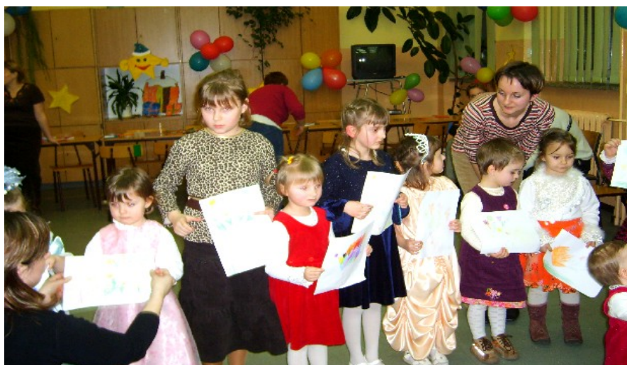
НОВОРІЧНА ЗАБАВА ДЛЯ ДІТЕЙ 2007 р.