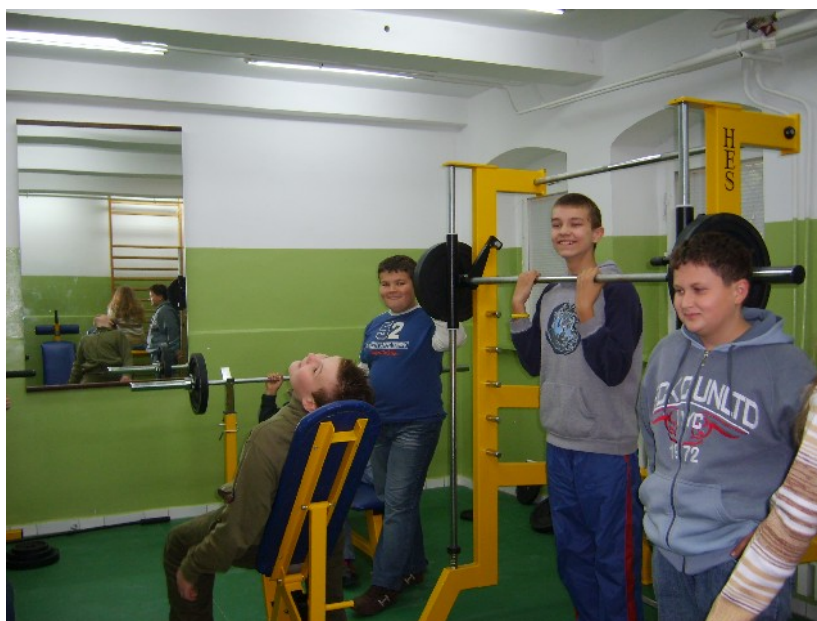
I КЛАС ГІМНАЗІЇ В ТРЕНУВАЛЬНОМУ ЗАЛІ

Минає 14-й рік існування школи у своєму будинку. Це вже п'ята адреса: Панцерна 10.