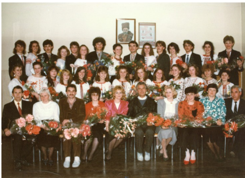
IV КЛАС ПРОЩАЄТЬСЯ ЗІ ШКОЛОЮ ТА ВЧИТЕЛЬСЬКИМ КОЛЕКТИВОМ 1990 р.